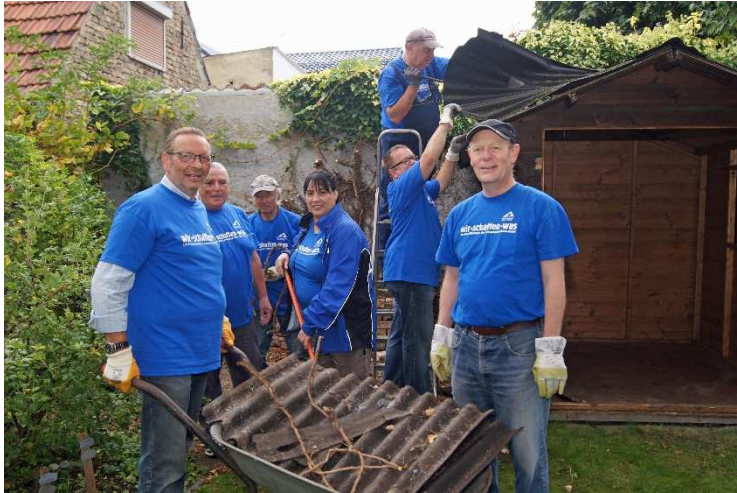
Unsere Helfer am Freiwilligentag im Museumsgarten

Am 20.9.2014 fand zum dritten Mal der Freiwilligentag in der Metropolregion Rhein-Neckar statt. Das Projekt unseres Vereins bestand darin, zwei baufällige Gar-